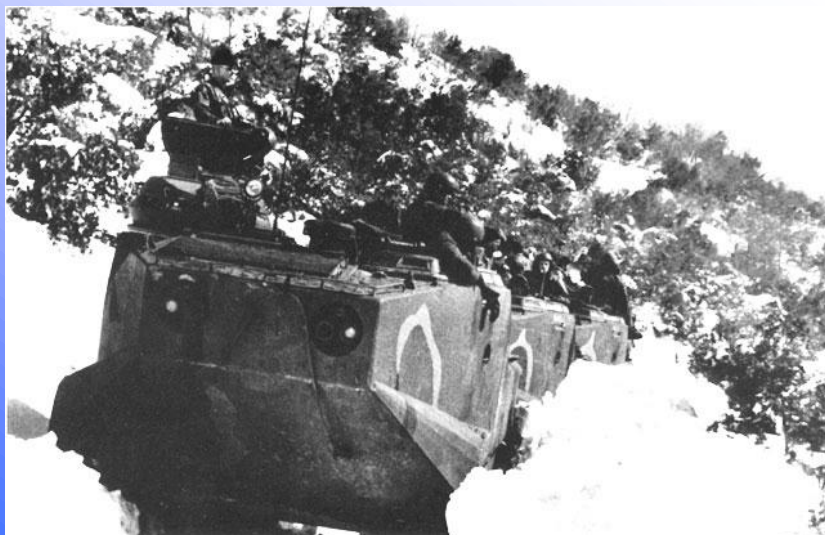
Obrněné transportéry 22d MAU se prodírají úzkou horskou silnicí během záchranných akcí po silných sněhových bouřích.