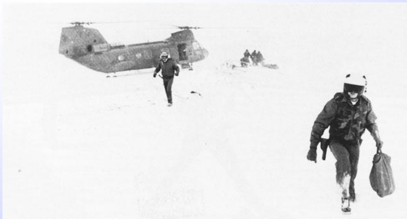
Vrtulník HMM-264 CH-46 přistávající kvůli evakuaci přeživších několika sněhových bouří v únoru 1983, které zrušily veškerou dopravu