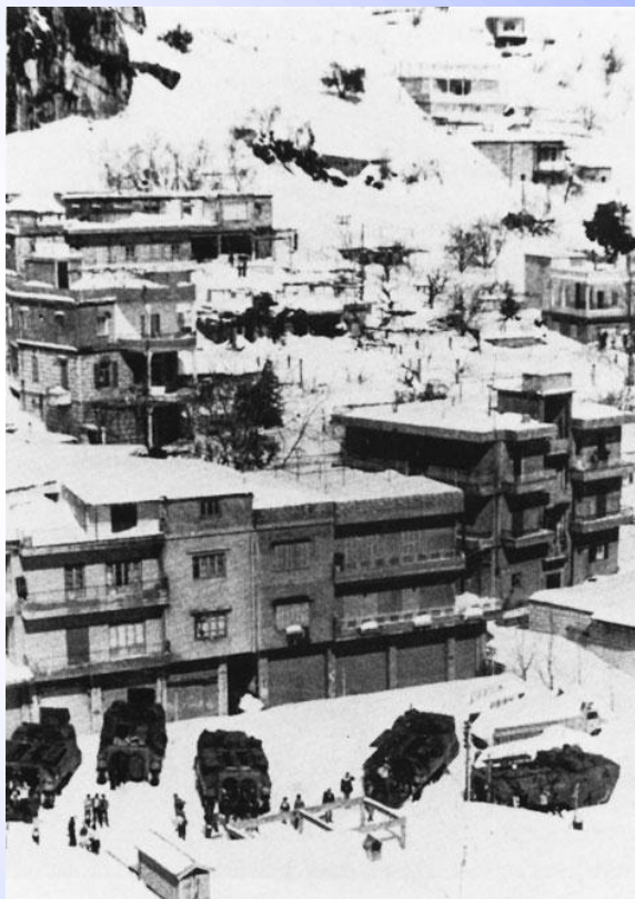
Další sněhová bouře v únoru 1983 – jedna z nejhorších v historii Libanonu – obrněné transportéry 22d MAU LVTP-7 se zúčastnily evakuace sněhem odříznutých obyvatel